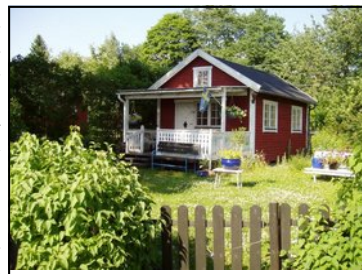
Casa passiva costruita in Svezia

restare indietro (gli unici edifici si sono realizzati solo nella provincia di Bolzano), nonostante le normative europee richiedano i migliori standard per soddisfare gli obiettivi del protocollo di Kyoto dal momento che l'utilizzo energetico degli edifici produce da solo il 40% di tutte le emissioni di CO2. Inoltre in Italia, prima si promuove una legge come la 10/91 che tra le fonti di energia assimilabili alle rinnovabili annovera i risparmi di energia conseguibili con gli interventi sull'involucro edilizio ma poi, non si incentiva come dovuto la società a muoversi in quella direzione. Sarebbe pertanto auspicabile che, in un futuro non troppo remoto, vi possa essere da parte delle istituzioni ma, anche da parte della società civile, la cultura del risparmio energetico quale prerogativa nella progettazione e nella costruzione.