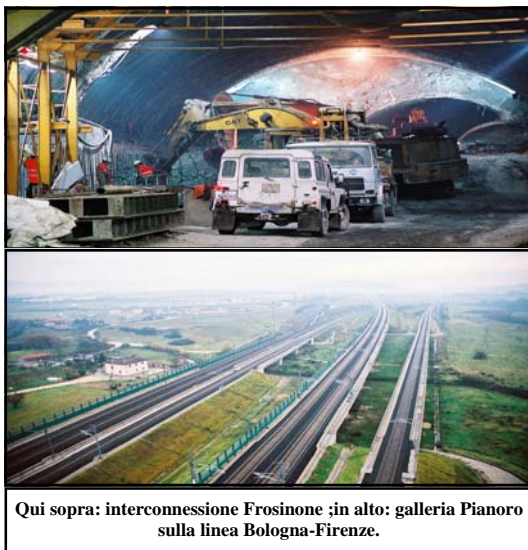
Qui sopra: interconnessione Frosinone ;in alto: galleria Pianoro sulla linea Bologna-Firenze.

Milano-Napoli ad interventi d'inserimento ambientale e socio-territoriale, mentre una pari quota è destinata agli indennizzi per espropri e danni nonché ad interventi sulla ferrovia esistente. Saranno eseguite opere per la tutela del patrimonio storico archeologico; il che, forse, con l'ambiente ha poco a che fare: ma testimonia l'impegno a conservare e non a distruggere. Il sistema Tav è parte integrante, probabilmente la più delicata, di quella sorta d'incrocio del Ten (Trans European Network) che disegna alcuni "corridoi" il primo dei quali, costituito dall'asse ferroviario Berlino-Palermo e il potenziamento del tunnel del Brennero e del ponte sullo Stretto entro il 2015. Insomma, la nuova cartina infrastrutturale d'Europa è disegnata, ed a tirare le linee non è stato un governo nazionale, ma una Commissione continentale che ha individuato nelle ferrovie il sistema più rapido, più efficiente, ma anche