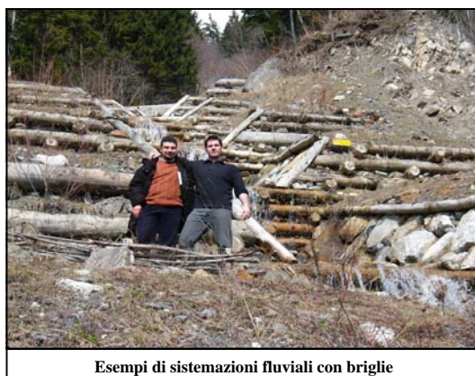
Esempi di sistemazioni fluviali con briglie

dinamica dell'ecosistema: piccole perturbazioni attivano elevata diversificazione, grandi disturbi sono indice di un processo di omogeneizzazione. La funzione di protezione dell'assetto idrogeologico e di uso ricreativo del territorio si deve necessariamente intendere nell'ottica del mantenimento della biodiversità.