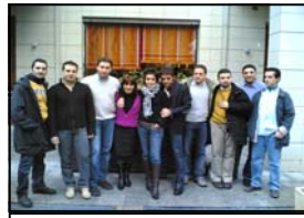
Membri dell'I.A.H.R. Calabria

alle associazioni accreditate affinché si faccia un uso più appropriato dei fondi stanziati, evitando sprechi e distrazioni. Valutata l'importanza di far parte fin dal primo momento di tale albo abbiamo provveduto a rispettare gli standard richiesti, anche se questo ci ha indotto a cambiare in corsa alcune cariche sociali, utili nei nostri progetti agli obiettivi culturali e scientifici connaturati alla nostra associazione. Abbiamo espresso un